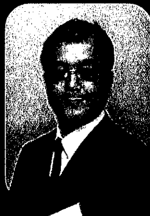
テノール・オペラ歌手 君島広昭